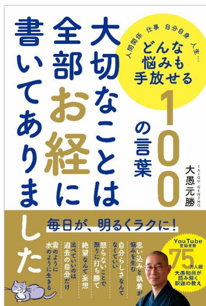
『大切なことは全部お経に書いてありました』(帯あり)

株式会社オレンジページ(東京都港区)は、YouTube チャンネル「大愚和尚の一言一答」登録者数 75 万人を超える佛心宗大叢山福厳寺住職・大愚元勝和尚による新刊『どんな悩みも手放せる 100 の言葉 大切なことは全部お経に書いてありました』を 12 月 17 日(水)に刊行しました。本書では、具体的な悩みに対し、解決の糸口となるお経の一説を一つ取り上げ、わかりやすい言葉で解説。生きづらさを感じている現代人の処方箋となる一冊です。